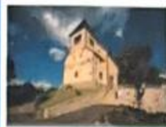
Eine Reise der Pfarrei St. Lioba Petersberg